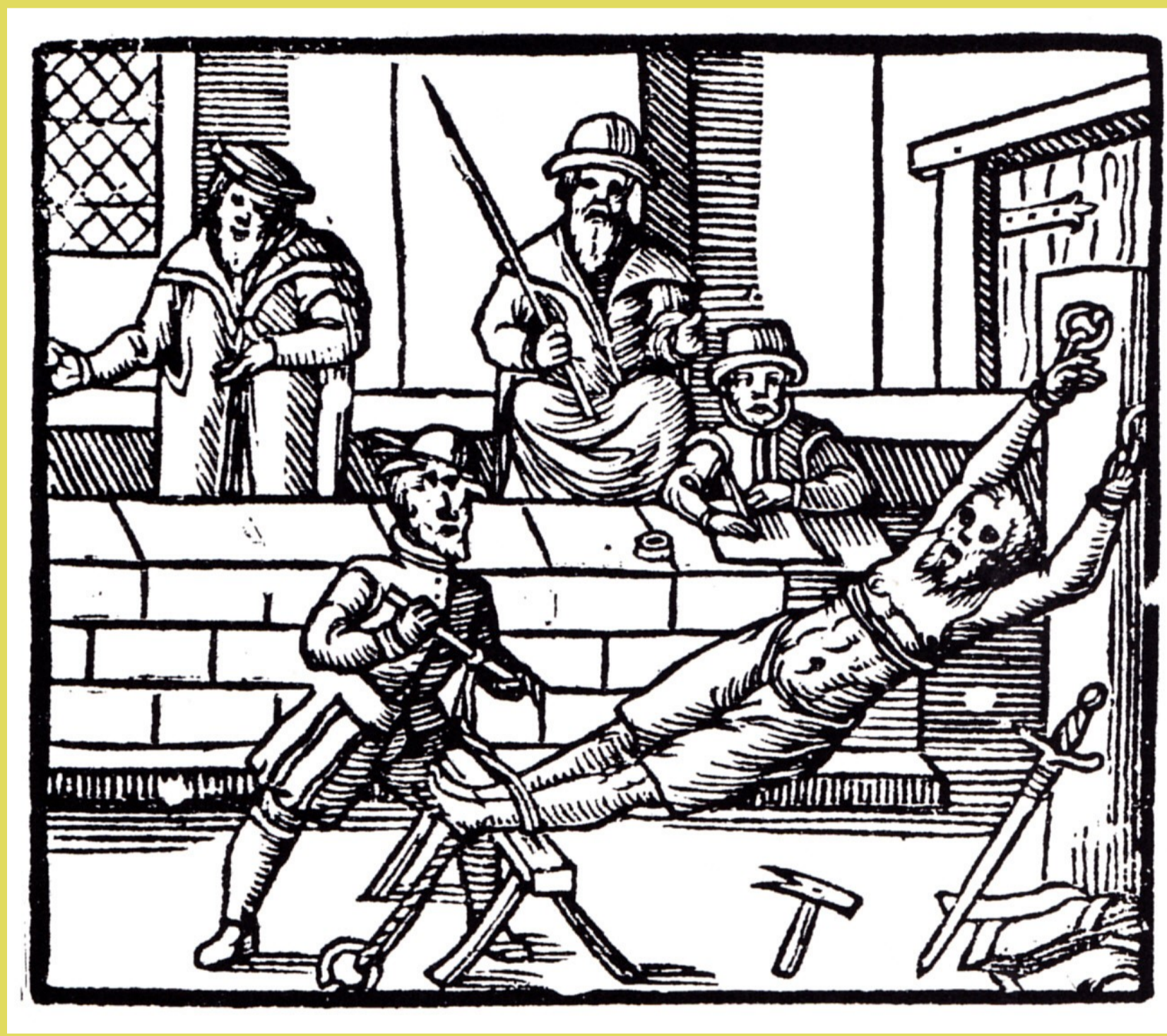
Foltering in de gerechtskamer