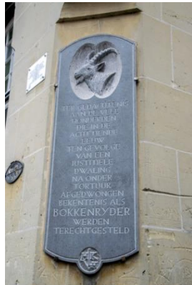
Figuur 3: Plaquette Bokkenrijders in Valkenburg

De identiteit verschaffende functie past goed bij de Bokkenrijders.