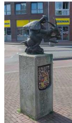
Figuur 2: Bokkenrijders beeld gemaakt door Paul Driessen

Mensen hadden bijvoorbeeld Bokkenrijders in de familie. Een boek zoals ‘Ze reden bij nacht’ is dan een goede identiteitsverschaffer. Er wordt namelijk niet alleen gekeken naar de kwaadaardigheid van de benden, maar juist naar de diepere impulsen. Door die identiteitverschaffende functie van het verschijnsel Bokkenrijders kan het zijn dat gemeentes Bokkenrijder-gemeente worden, dat er beelden geplaatst worden op markten (zoals in Schaesberg) of een plaquette op een gebouw (zoals in Valkenburg).